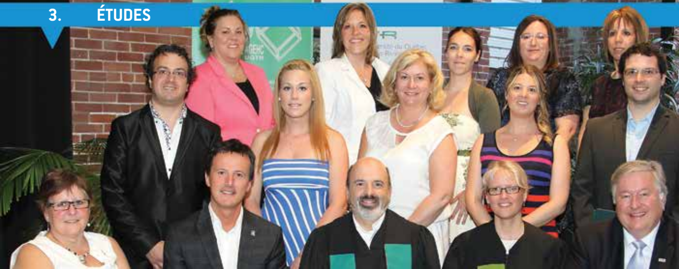
Cérémonie de remise des diplômes des finissants 2014 du Centre universitaire de la Vallée-du-Haut-Saint-Laurent